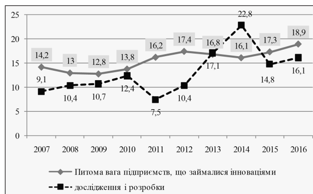
Рис. 1. Питома вага підприємств, що займаються інноваціями за період з 2007 по 2016 рр.

В сучасних умовах господарювання для забезпечення темпів і якості економічного зростання, конкурентоспроможності продукції, що випускається на внутрішніх і зовнішніх ринках, розвиток всіх галузей народного господарства повинен мати інноваційний характер. Це складне завдання, оскільки будь-яке сучасне підприємство стоїть перед вибором: якщо воно не виробляє нову продукцію, то рано чи пізно воно збанкрутує, якщо виробляє, то налагодження випуску нових виробів пов'язане з великими витратами, а отже, виникає необхідність мати достатнє фінансове забезпечення. Це приводить до того, що, згідно з офіційними даними, станом на 1 січня 2017 р. в промисловості тільки 18,9% організацій самостійно займаються інноваціями, 16,1% займаються науковими дослідженнями і розробками (рис. 1).