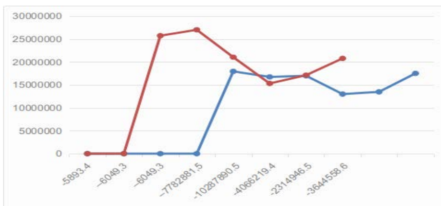
Рис. 1. Графічне відображення зовнішньої торгівлі України з ЄС за 2009–2017 рік [9]

Для оптимізації митних процедур варто запровадити наступне: об'єднання контролю за експортом, імпортом і транзитом; єдиний облік торгівців із реєстрацією тільки в одній країні; єдиний електронний доступ до послуг у сфері зовнішньоекономічної діяльності; покращення обміну електронної інформації між всіма органами влади, що стосуються зовнішньоекономічних операцій; відбір товарів на митну доглядку базується на основі автоматизованого аналізу ризиків; надання митної декларації в електронному вигляді згідно міжнародних стандартів, зокрема які будуть релевантними до правил країн-членів ЄС. Тому одним з напрямків впливу митної політики на національну економіку може стати міжнародна кооперація, а також активна участь держави у спеціалізації з урахуванням національних інтересів [5]. Обсяги зовнішньої торгівлі України з Євросоюзом у 2009–2017 роках наведено у таблиці 1 та на рис. 1.