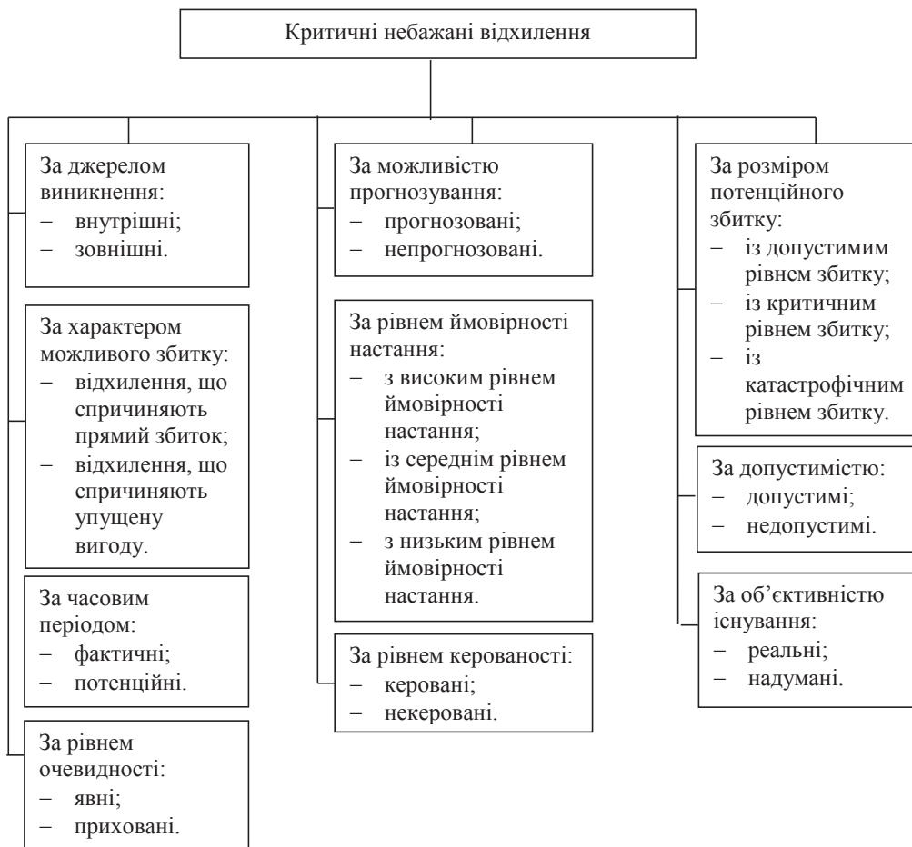
Рис. 2. Типологія критичних небажаних відхилень у діяльності підприємств

Як свідчать результати виконаних автором досліджень, ефективно функціонуючи, система стрес-менеджменту на підприємстві сприяє істотному зниженню негативних явищ, а також прискорює час реагування на наслідки особистісних, групових чи корпоративних стресів. Окрім того, така