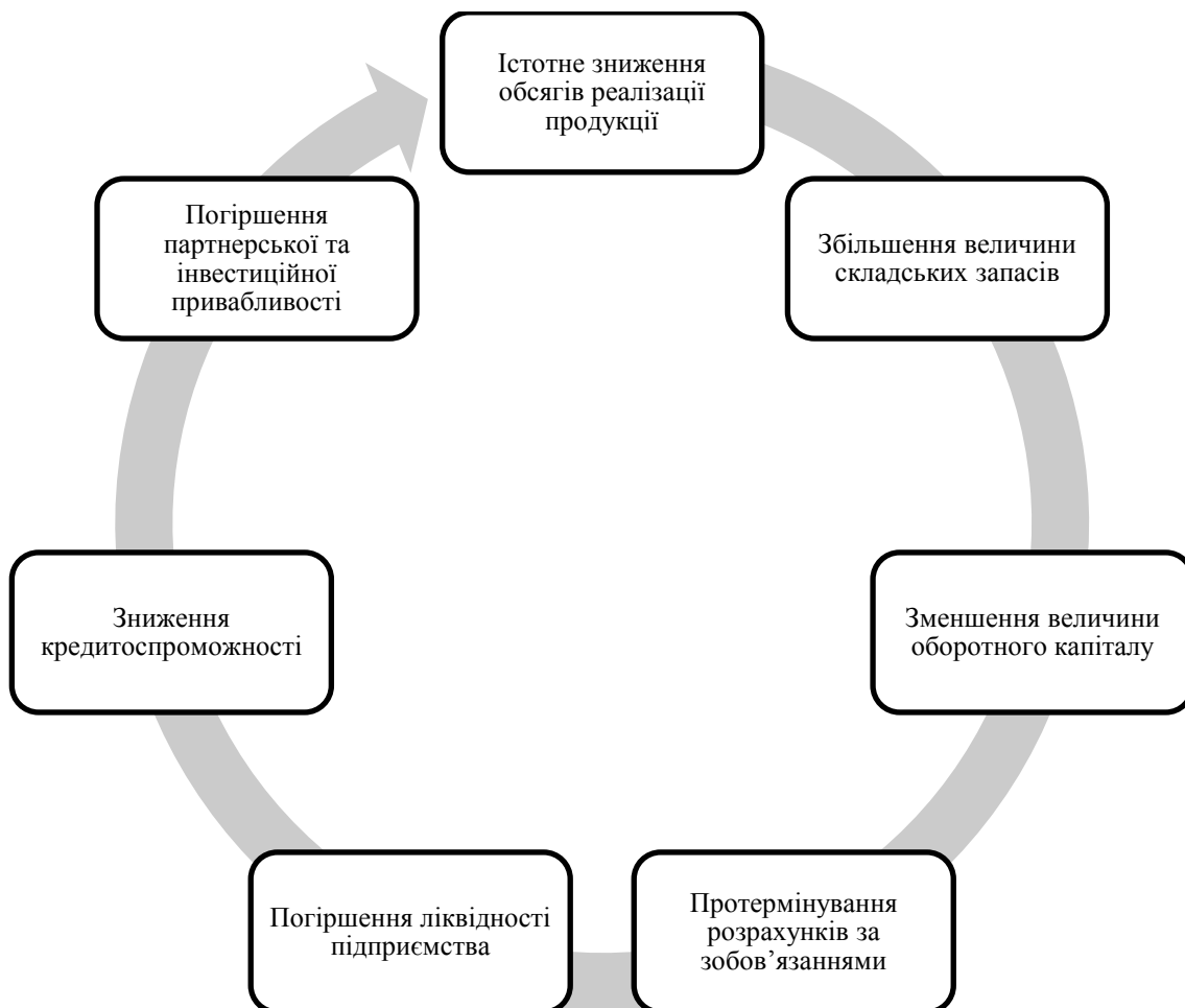
Рис. 1. Приклад взаємозалежності критичних небажаних відхилень на підприємстві

Критичні небажані відхилення, які є істотними, екстремальними та чинять вагомий негативний вплив на функціонування підприємств, виникають з різних причин, як внутрішніх, так і зовнішніх. Частина з них може виникати раптово, а інша частина