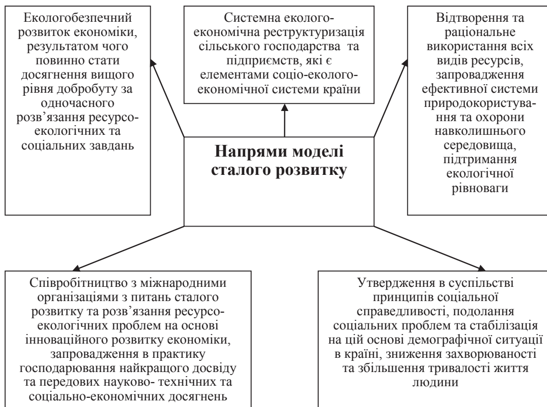
Рис. 3. Основні умови переходу на модель сталого розвитку

Вплив внутрішніх чинників більшою мірою залежить від системи менеджменту, а саме: наявності висококваліфікованих керівників, які здатні приймати оптимальні управлінські рішення, використовувати найкращі світові практики, сучасні технології для модернізації і диверсифікації виробництва, ефективно використовувати ресурсний потенціал, адаптуватися до мінливих умов зовніш-