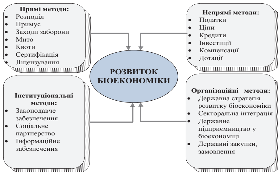
Рис. 2. Система методів державного регулювання розвитку біоекономіки

У період розвитку біоекономіки причини «провалів» ринку й необхідність державного регулювання набувають певної специфіки, що зумовлена своєрідними завданнями держави та, що найсуттєвіше, інституційною недостатністю забезпечення ефективної взаємодії між державним, приватним і громадським секторами економіки в умовах розвитку біоекономіки. Зокрема, доступність, поширення та достовірність інформації про розвиток біоекономіки, біотехнологічну продукцію мають ключове значення для прийняття рішень як в умовах ринкової взаємодії, так і під час здійснення державного регулювання.