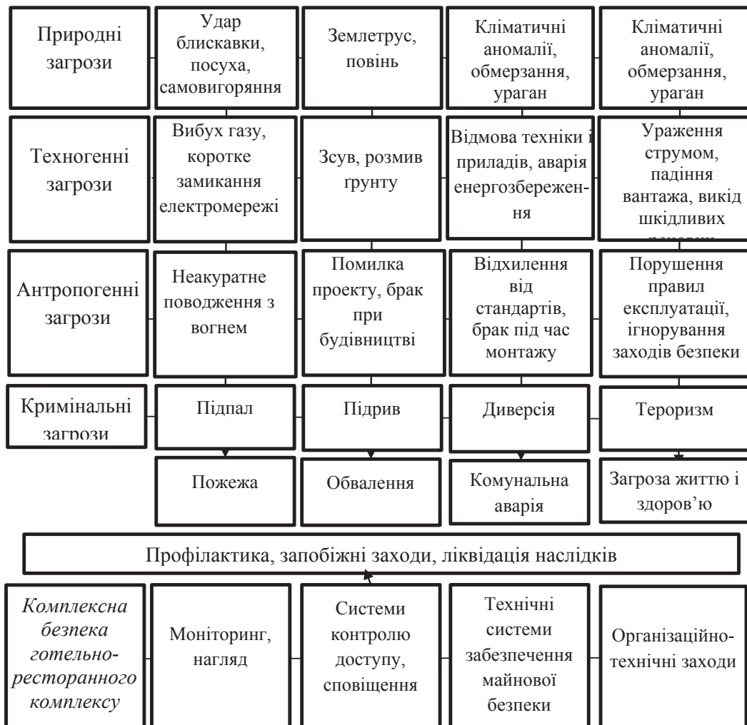
Рис. 1. Загрози майнової безпеці готельно-ресторанних комплексів та ймовірні наслідки їх реалізації

Проведене дослідження характерних для майнової безпеки готельно-ресторанних комплексів загроз дало змогу згрупувати їх на рис. 1 та визначити наслідки їх реалізації для майнової безпеки підприємств сфери гостинності.