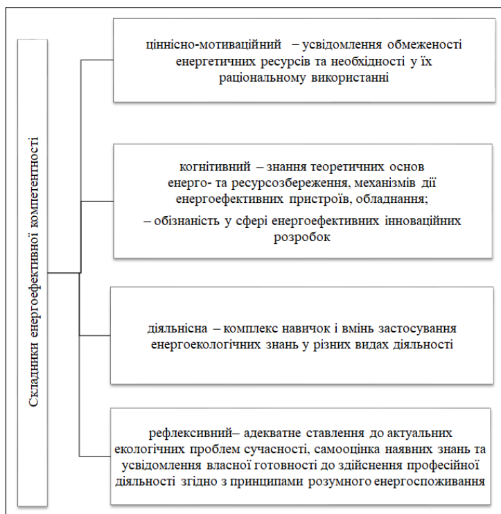
Рис. 1. Складники енергоефективної компетентності [1]

тиск, який на них чинить залежність від енергоресурсів, вирішувати питання ненадійності енергопостачання, нерівності, високих цін і рахунків за енергоресурси, а також екологічної шкоди і збитків здоров'ю. Власники підприємств і менеджери також розуміють, що енергоефективність – це ключ до конкурентоспроможності підприємства на відкритому ринку. Під енергоефективністю будемо розуміти ефективне (раціональне) використання енергетичних ресурсів, використання меншої кількості енергії для досягнення того ж рівня енергетичного забезпечення підприємства. Умовами