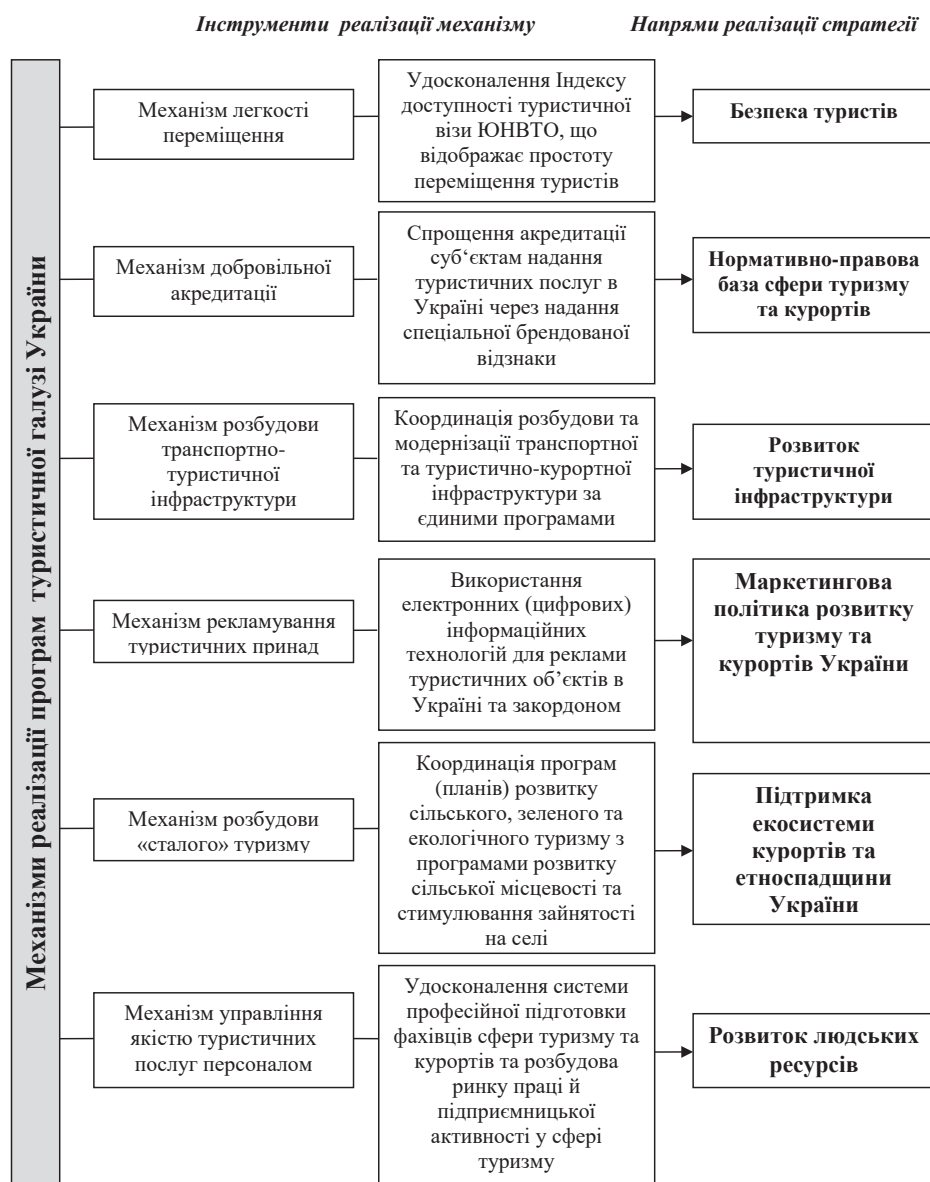
Рис. 1. Механізми реалізації програм туристичної галузі відповідно до напрямів стратегії розвитку туризму в Україні (побудовано автором на основі матеріалів [1; 5])

відновлені СЕЗ, туристично-курортні ареали як укрупнені «точки зростання» туристичного потенціалу країни та туристичні кластери з поєднанням різноманітних, але економічно та екологічно близьких видів туризму.