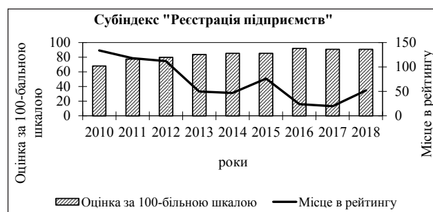
Рис. 1. Зміна позицій України в рейтингу «Ведення бізнесу» за субіндексом «Реєстрація підприємств» (складено автором на основі [8])

Перш за все, варто оцінити позиції України за субіндексом «Реєстрація підприємств» (Starting a business), зміна яких впродовж досліджуваного періоду наведена на рис. 1.