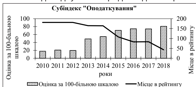
Рис. 7. Зміна позицій України в рейтингу «Ведення бізнесу» за субіндексом «Оподаткування» (складено автором на основі [8])

Зміна позицій України за субіндексом «Оподаткування» за досліджуваний період наведена на рис. 7.