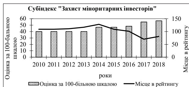
Рис. 6. Зміна позицій України в рейтингу «Ведення бізнесу» за субіндексом «Захист міноритарних інвесторів» (складено автором на основі [8])

На рис. 6 наведено зміну позицій країни за субіндексом «Захист міноритарних інвесторів»