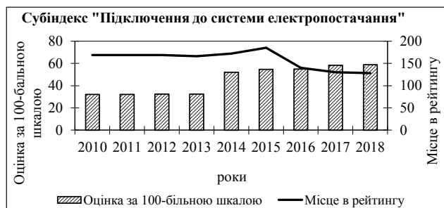
Рис. 3. Зміна позицій України в рейтингу «Ведення бізнесу» за субіндексом «Підключення до системи електропостачання» (складено автором на основі [8])

На рис. 2 наведена зміна позицій України за субіндексом «Підключення до системи електропостачання».