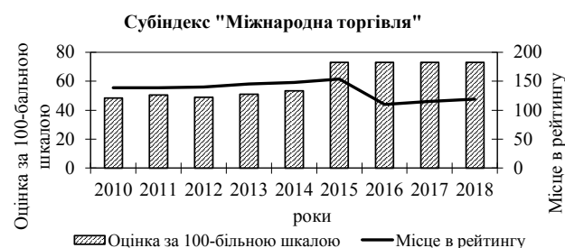
Рис. 8. Зміна позицій України в рейтингу «Ведення бізнесу» за субіндексом «Міжнародна торгівля» (складено автором на основі [8])

На рис. 8 наведено зміну позицій України за субіндексом «Міжнародна торгівля»