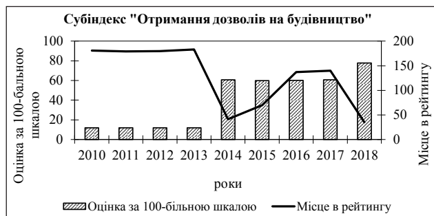
Рис. 2. Зміна позицій України в рейтингу «Ведення бізнесу» за субіндексом «Отримання дозволів на будівництво» (складено автором на основі [8])

На рис. 2 наведена зміна позицій України за субіндексом «Отримання дозволів на будівництво».