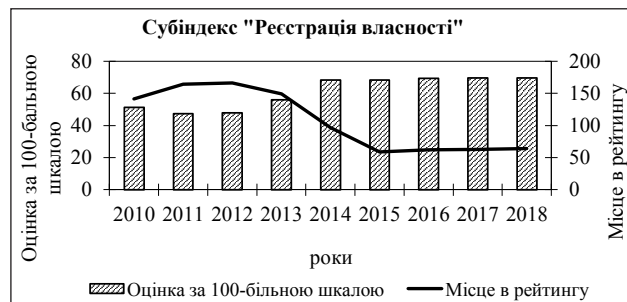
Рис. 4. Зміна позицій України в рейтингу «Ведення бізнесу» за субіндексом «Реєстрація власності» (складено автором на основі [8])

покращилось – країна перемістилась з 141 на 64 місце. Такі зміни свідчать про значне покращення умов реєстрації власності для суб'єктів господарювання.