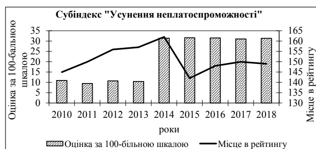
Рис. 10. Зміна позицій України в рейтингу «Ведення бізнесу» за субіндексом «Усунення неплатоспроможності» (складено автором на основі [8])

Нами запропоновано визначити індикатори абсолютної та порівняльної зміни певних умов внаслідок регуляторної політики. Абсолютна зміна характеризує зміну бальної оцінки країни, тоді як порівняльна – зміну місця країни в рейтингу.