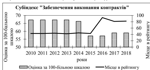
Рис. 9. Зміна позицій України в рейтингу «Ведення бізнесу» за субіндексом «Забезпечення виконання контрактів» (складено автором на основі [8])

інших країн погіршилось (149 місце у 2018 році порівняно з 145 місцем у 2010 році).