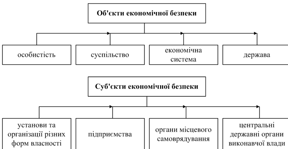
Рис. 3. Об'єкти та суб'єкти економічної безпеки