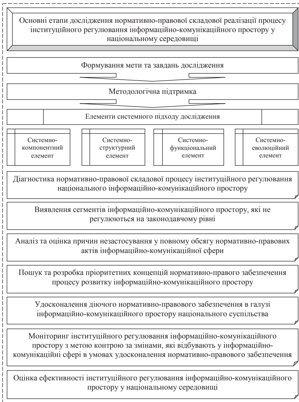
Рис. 1. Основні етапи дослідження нормативно-правової складової реалізації процесу інституційного регулювання інформаційно-комунікаційного простору у національному середовищі

– системно-структурний – дослідження топології об'єкта дослідження;