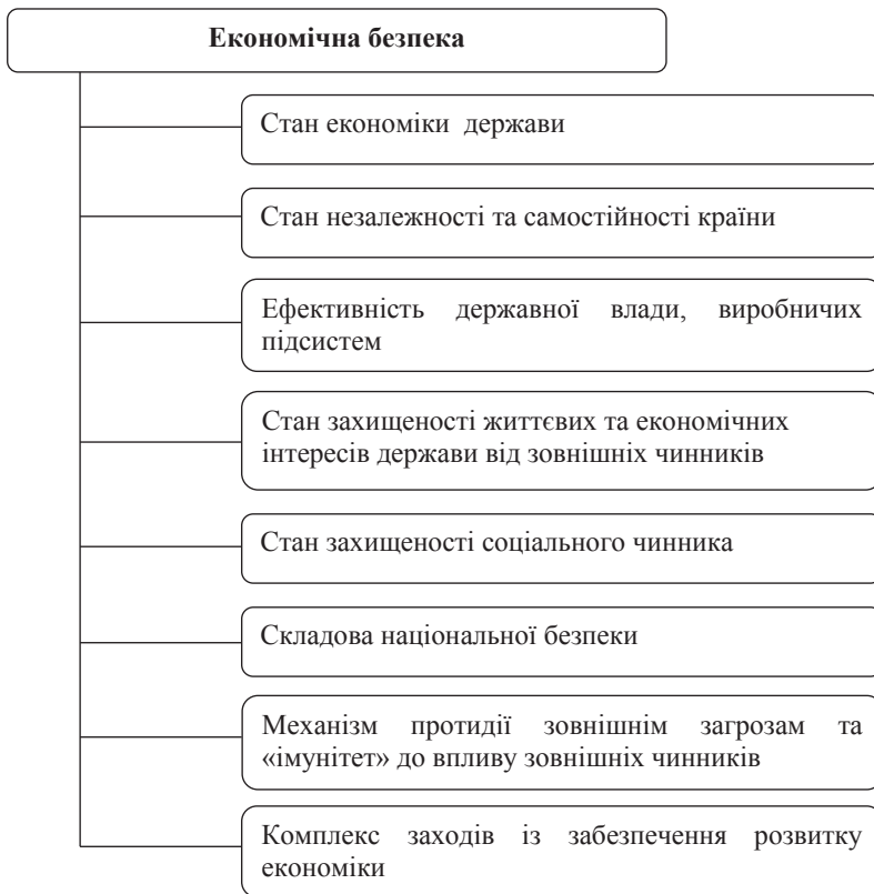
Рис. 1. Основні напрями визначення категорії «економічна безпека»