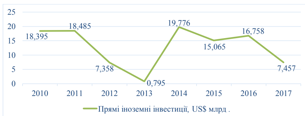
Рис. 1. Надходження прямих іноземних інвестицій в економіку Польщі за 2010–2017 роки

Як видно з рис. 3, Польща мала переважно негативний платіжний баланс, однак у 2017 році ситуація змінилась, коли він набув позитивного