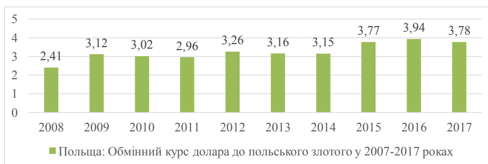
Рис. 2. Обмінний курс долара до польського злотого у 2008–2017 роки

Темп зростання ВВП. ВВП є одним з основних показників економічного розвитку країни. Його зростання акомпанує збільшенням кількості зайнятих та покращенням рівня життя. Розглянемо темпи зростання ВВП Польщі на рис. 4.