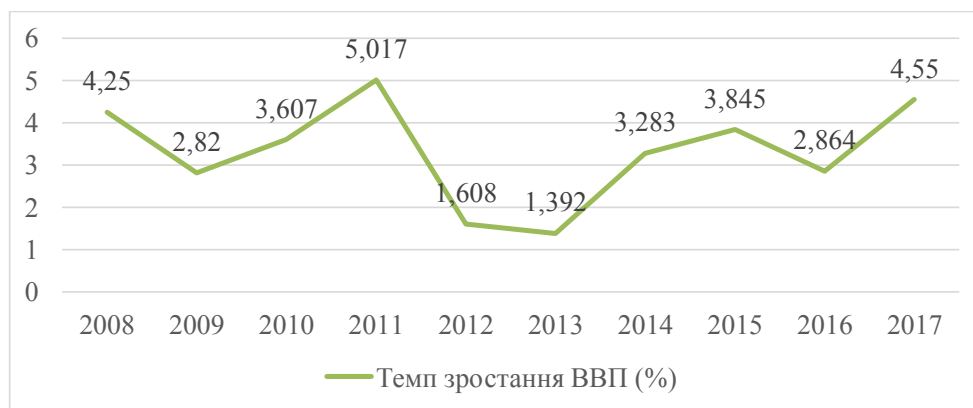
Рис. 4. Темп зростання ВВП (%) Польщі у 2008–2017 роках