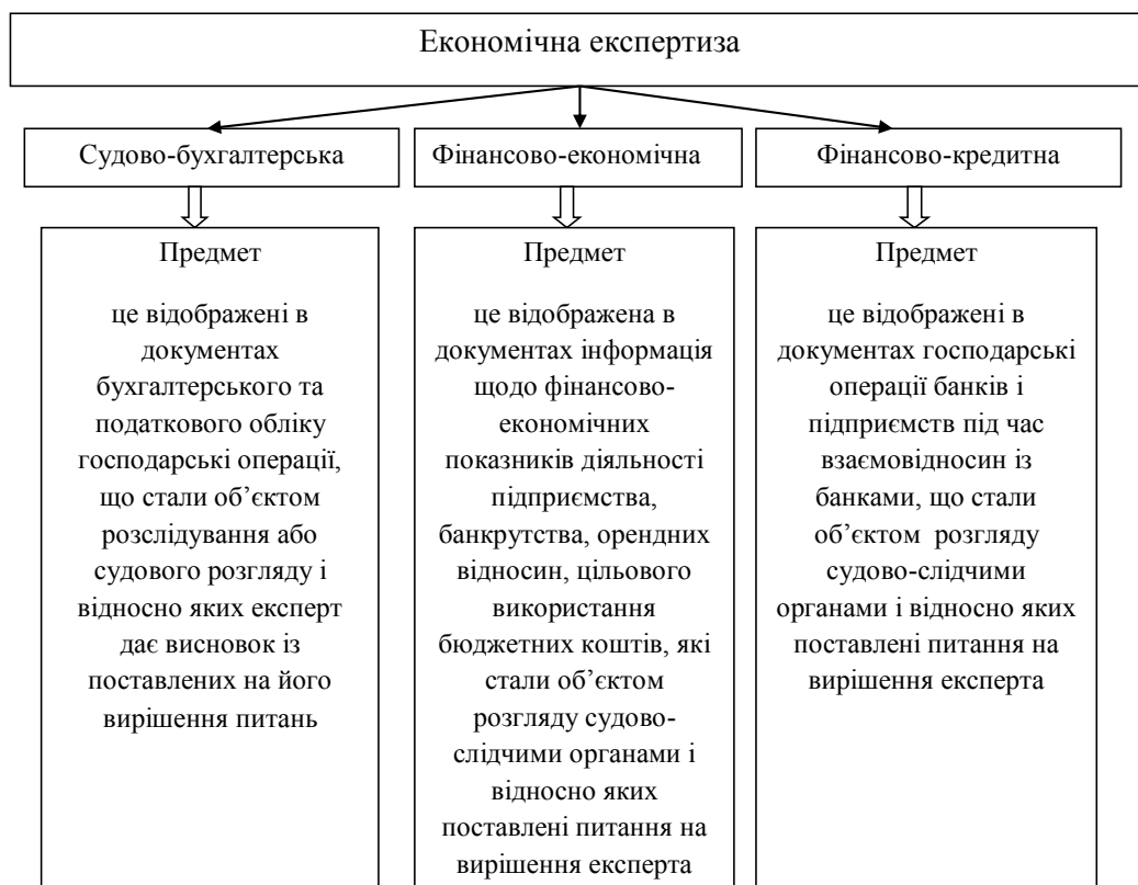
Рис. 2. Предмет економічної експертизи

експертизи, які він може вирішувати. Предмет експертизи – її суттєва ознака, якою визначаються знання експерта будь якої спеціальності.