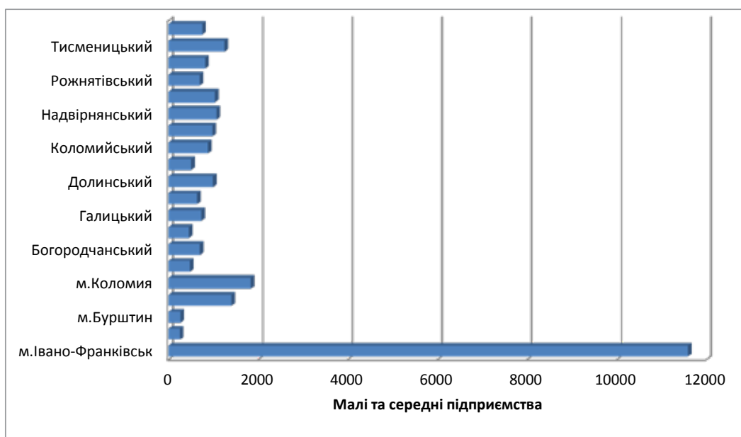
Рис. 2. Розподіл малих та середніх підприємств за районами Івано-Франківської області станом на 2017 р.

Сьогодні стан малого і середнього підприємництва в області має такі недоліки: нерівномірність концентрації суб'єктів малого і середнього підприємництва за регіонами (найбільша кількість зазначених суб'єктів у містах Івано-Франківську, Калуші, Коломиї (рис. 2); нерівномірність розподілу за видами економічної діяльності (рис. 3), що свідчить про значну кількість зареєстрованих малих підприємств, яка займається лише швидкоприбутковими видами господарської діяльності; продукція значної частини суб'єктів підприємницької діяльності не сертифікована чи не відповідає вимогам європейських стандартів; низький рівень упровадження