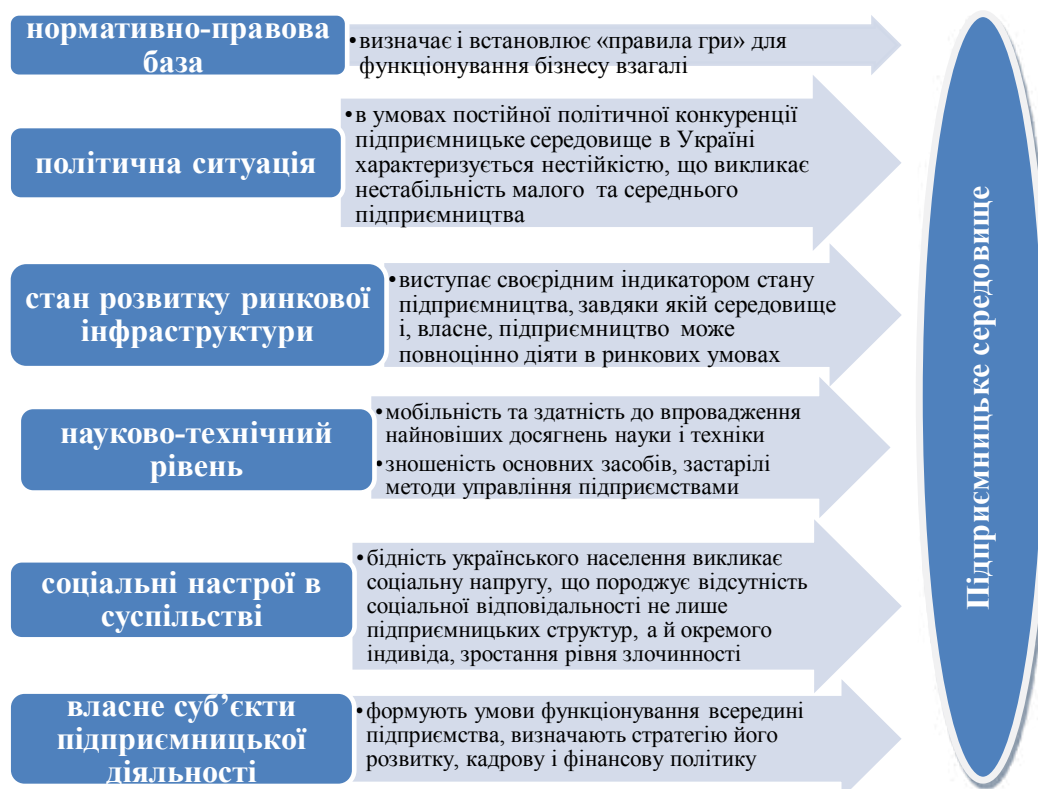
Рис. 1. Компоненти підприємницького середовища в Україні

Узагальнюючи погляди вчених-економістів, вважаємо, що підприємницьке середовище – це певні умови, які створюються в суспільстві і впливають на розвиток та функціонування суб'єктів підприємницької діяльності. Проте для більш комплексного його розуміння, визначення засад його впливу на розвиток підприємництва доцільно виділити компоненти підприємницького середовища, які через дію тих чи інших чинників впливають на підприємство в Україні (рис. 1).