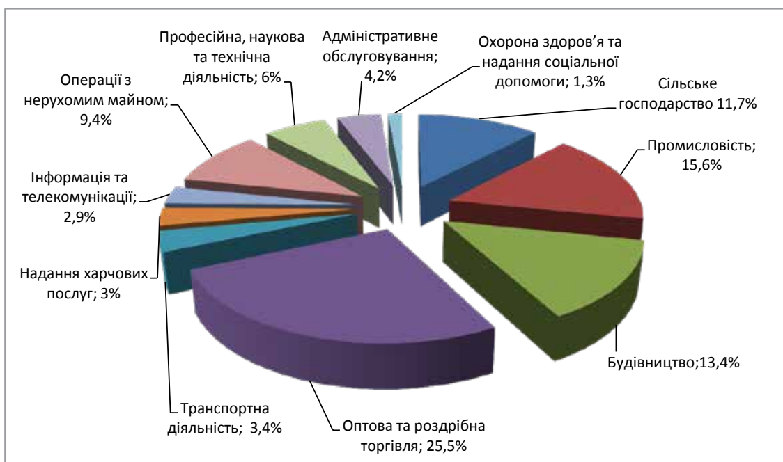
Рис. 3. Структура малих та середніх підприємств за видами діяльності