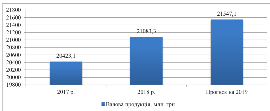
Рис. 4. Виробництво валової продукції сільського господарства Вінницької області по всіх категоріях господарств у цінах 2010 року, млн. грн.

Висновки з проведеного дослідження. Підводячи підсумки перспектив багатофункціонального розвитку сільських територій України в цілому та Вінницької області зокрема, слід зазначити, що