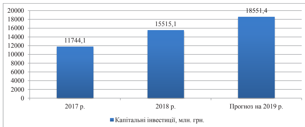
Рис. 5. Обсяг капітальних інвестицій Вінницької області у фактичних цінах, млн. грн.