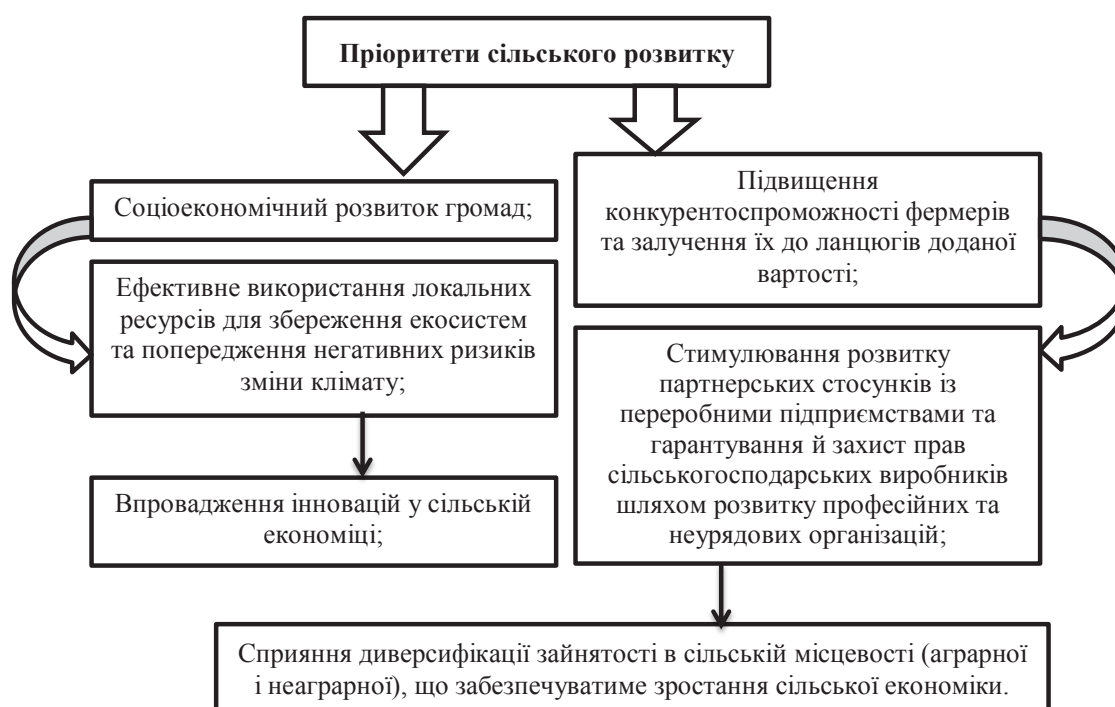
Рис. 3. Головні пріоритети сільського розвитку

– індекс реальної заробітної плати за 9 місяців 2018 р. до відповідного періоду минулого року склав 115,7% (2-е місце серед регіонів України) [10].