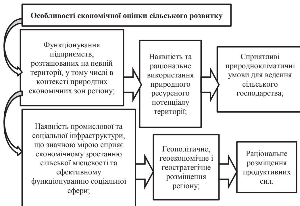
Рис. 1. Головні особливості економічної оцінки сільського розвитку

З метою подолання проблем розвитку сільських територій України, Кабінет Міністрів схвалив Концепцію Державної цільової програми сталого розвитку сільських територій на період до 2020 року. Метою Програми є забезпечення сталого розви-