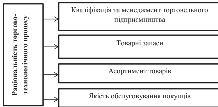
Рис. 3. Інструменти раціонального здійснення торгово-технологічного процесу

рів, скорочення його широти, перебої в реалізації окремих видів товарів мають не тільки від'ємний поточний результат (у вигляді зниження обсягів товарообороту та прибутку), але й негативні наслідки для іміджу та конкурентоспроможності підприємства, призводить до втрати покупців;