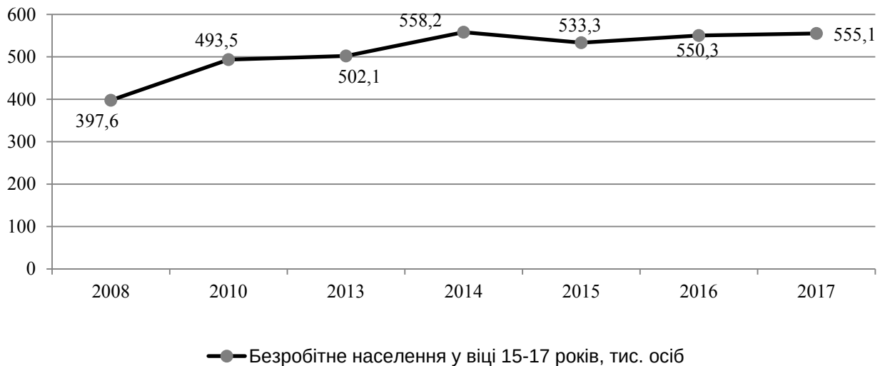
Рис. 4. Безробітне населення у сільській місцевості, тис. осіб