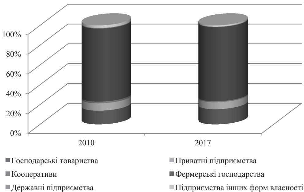
Рис. 2. Структура сільськогосподарських підприємств, %