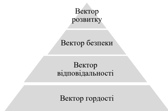
Рис. 4. Вектори Стратегії сталого розвитку «Україна – 2020»

Впроваджено Національну стратегію у сфері прав людини на період до 2020 р. [8]. Вектори, визначені у Стратегії сталого розвитку «Україна – 2020», зображено на рис. 4.