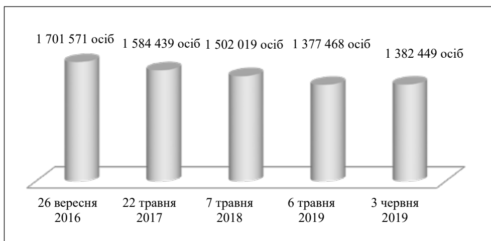
Рис. 1. Динаміка кількості ВПО в Україні за 2016–2019 рр.

З наведених даних можна помітити таке. Найбільш вагомими центрами тяжіння міграційних потоків є Донецька (36,0% усіх зареєстрованих ВПО) та Луганська (19,9%) області, далі з великим відривом йдуть м. Київ (10,0%), Харківська (9,2%) та Дніпропетровська (5,0%) області. Такий розподіл можна пояснити щонайменше двома чинниками, а саме географічною близькістю роз-