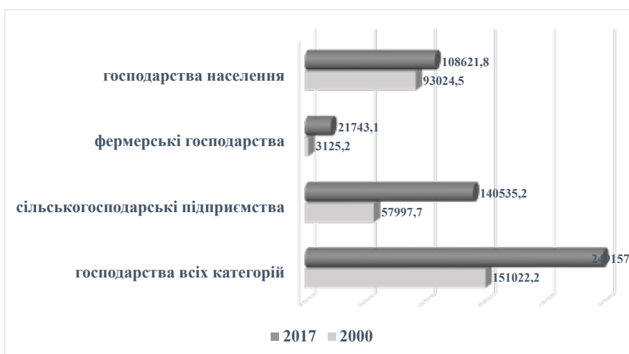
Рис. 2. Порівняння виробництва продукції сільського господарства за категоріями господарств в Україні у 2000 та 2017 рр., млн. грн. (у постійних цінах 2010 р.)

Виходячи з вищевикладеного, можемо зробити висновок, що наявні тенденції розвитку аграрного сектору найближчим десятиліттям приведуть до: