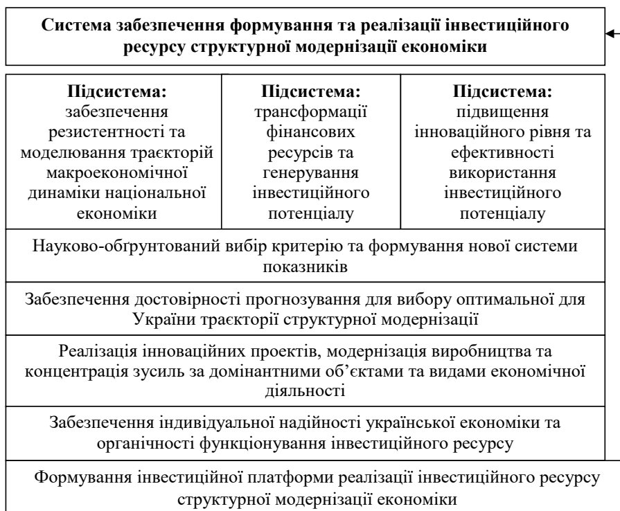
Рис. 2. Блок-схема структури системи забезпечення формування та реалізації інвестиційного ресурсу структурної модернізації економіки України

Питання про початкові капітальні вкладення капіталу, що здатні ініціювати прогресивні струк-