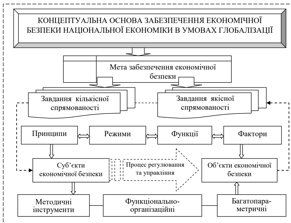
Рис. 1. Концептуальна основа забезпечення економічної безпеки національної економіки в умовах глобалізації

Наслідком цілісності системи є інтегративність, яка складає базовий аспект будь-якої системи: політичної, господарської, технологічної, економічної, соціальної, природоохоронної тощо. Інтегративність системи в абстрактній формі виражається в незвідності компонентів системи до їх суми, яка більше доданих. Тобто, система через взаємодію її сегментів створює додаткову продуктивну силу, яка