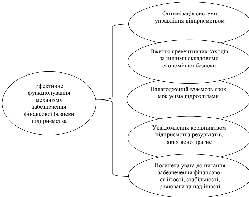
Рис. 3. Основні потреби ефективного функціонування механізму забезпечення фінансової безпеки підприємства