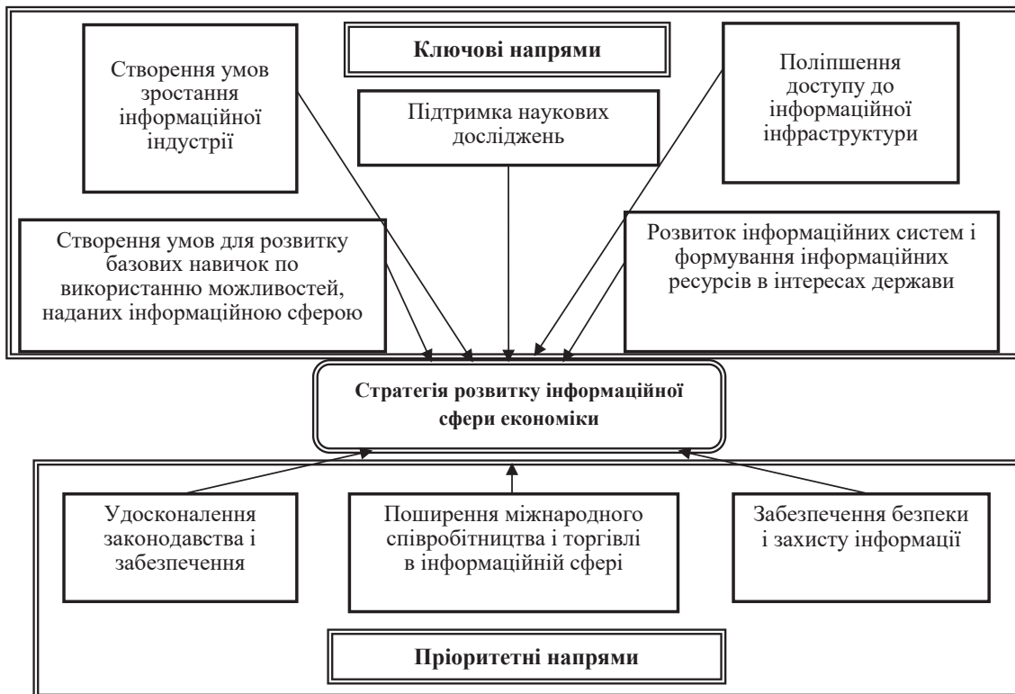
Рис. 2. Схема напрямів реалізації стратегії розвитку інформаційної сфери економіки