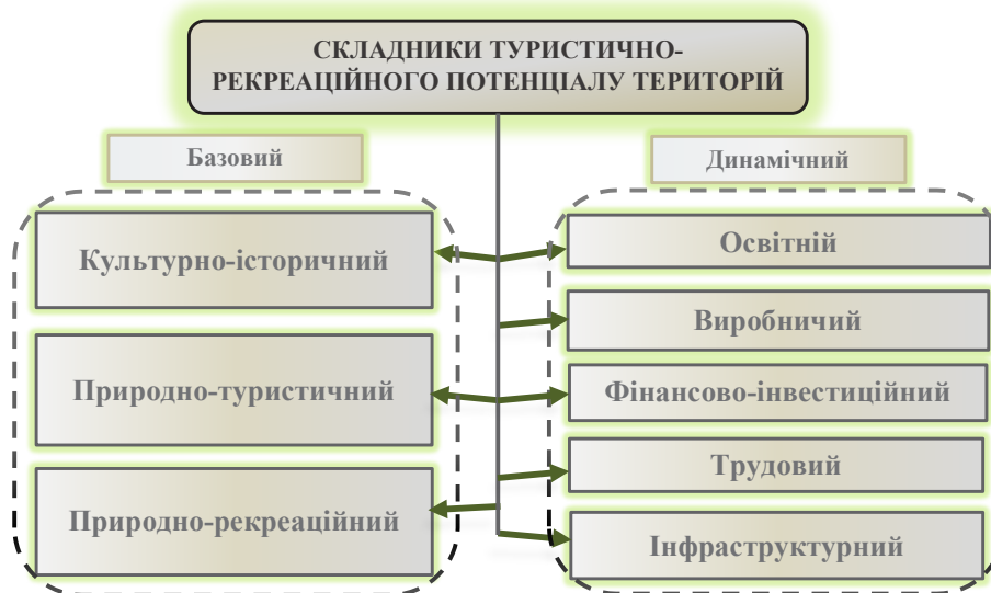
Рис. 2. Класифікація туристично-рекреаційного потенціалу за П. Вірченко