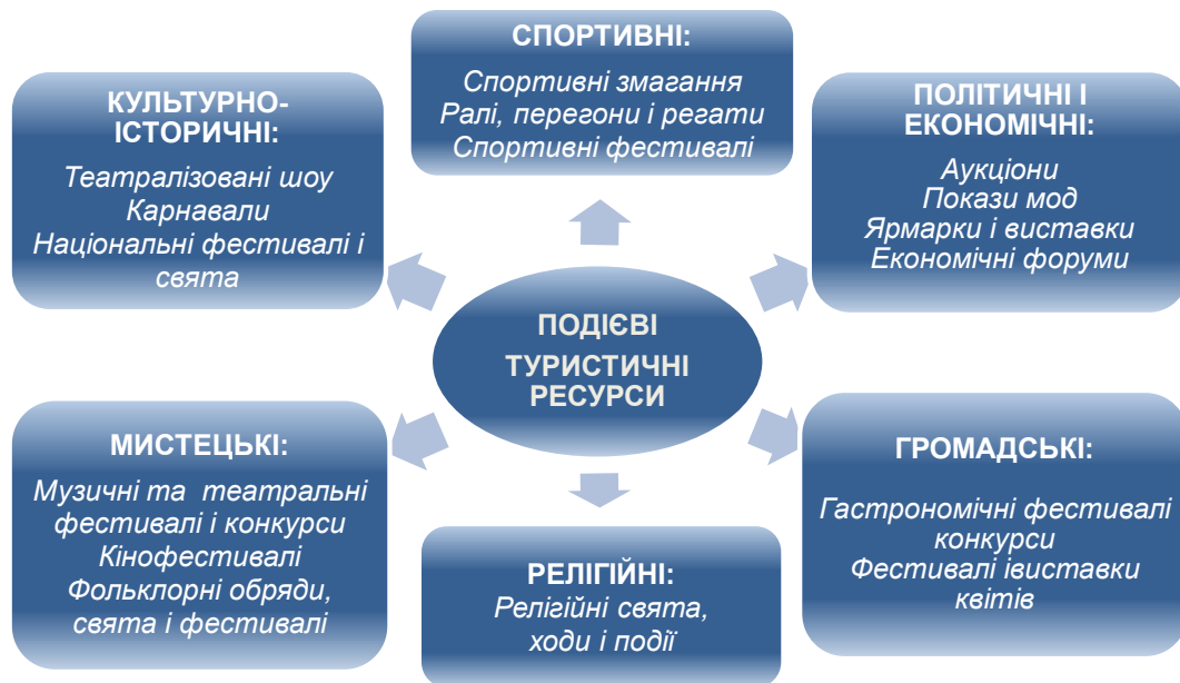
Рис. 3. Класифікація подієвих туристичних ресурсів