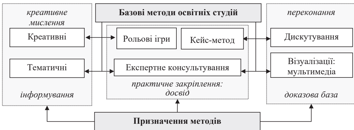
Рис. 2. Методи освітніх студій сталого розвитку та їх призначення

2. Коучинг підприємництва сталого розвитку – це колаборація з надання допомоги підприємцям у досягненні ними конкретних освітніх і професійних результатів з метою поглиблення знань зі сталого розвитку, його можливостей для розвитку підприємництва, покращення якості підприємницької