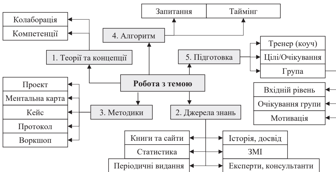
Рис. 3. Структурно-логічна схема знаннявої основи та інструментального забезпечення тематики освітніх студій підприємництва сталого розвитку

Методологію навчання підприємців для тренувальних програм розкрито на прикладі: 1) загальної характеристики методів, що обрано для двох тренувальних програм – а) інкубації та б) акселерації, та 2) поглибленого висвітлення методології їх проведення.