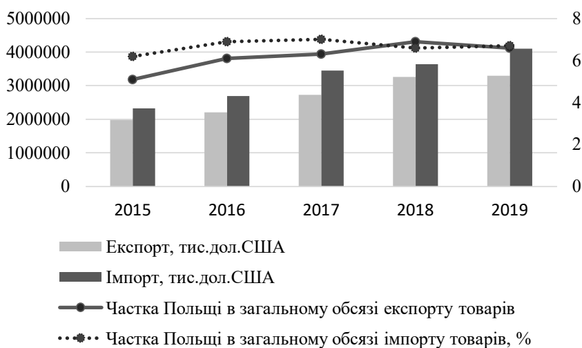
Рис. 2. Динаміка зовнішньої торгівлі товарами України та Польщі