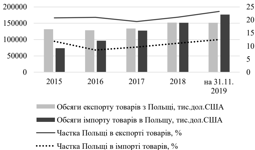
Рис. 4. Зовнішня торгівля товарами Волинської області та Польщі