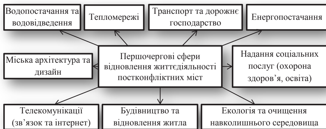
Рис. 1. Сфери першочергового відновлення життєдіяльності постконфліктних міст

До економічних проблем слід віднести також макроекономічні, такі як «поглиблення економічної кризи, гальмування або призупинення економічних реформ у країні, затримка економічного