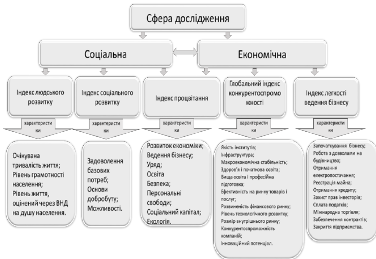
Рис. 1. Групування основних індексів міжнародних рейтингів

Таким чином, у світовому порівнянні можна констатувати погіршення соціально-економічної ситуа-