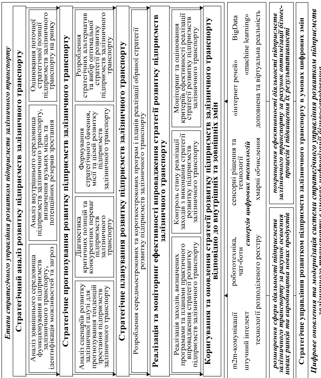
Рис. 1. Особливості формування та реалізації системи стратегічного управління розвитком підприємств залізничного транспорту в умовах трансформаційних змін бізнес-середовища