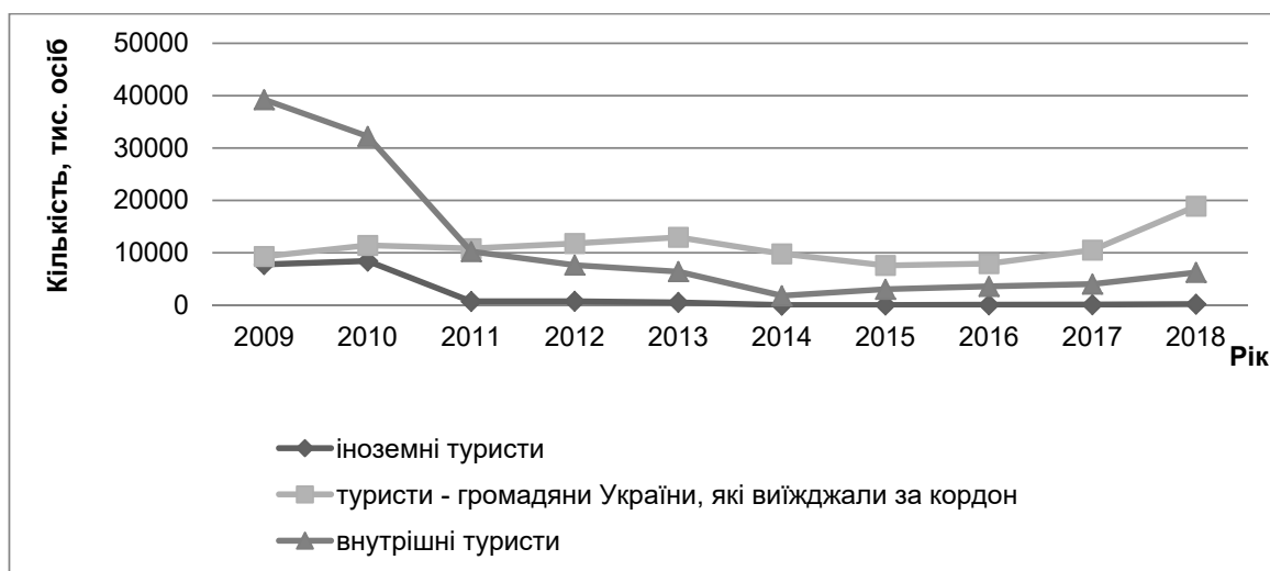
Рис. 3. Динаміка туристичних потоків Закарпатської області за 2009–2018 рр.