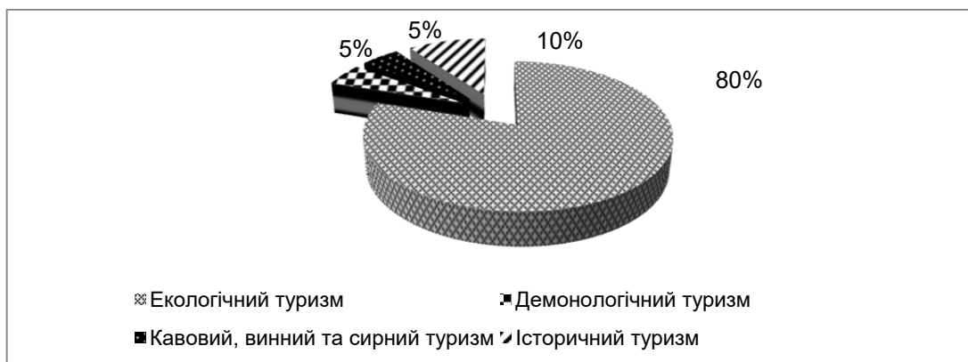
Рис. 4. Динаміка розвитку видів туризму в Закарпатській області протягом 2014–2018 рр.