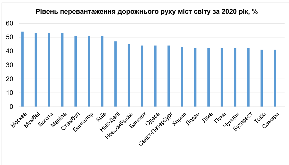
Рис. 2. Топ-20 міжнародного рейтингу найбільш завантажених по дорожньому руху міст світу

Дослідження [6] проводилося з метою з'ясування зв'язку здоров'я з транспортним стресом, який сприймається індивідуально, а також з екологічним навантаженням на транспорт. Було відзначено, що «дорожній стрес, що сприймається,