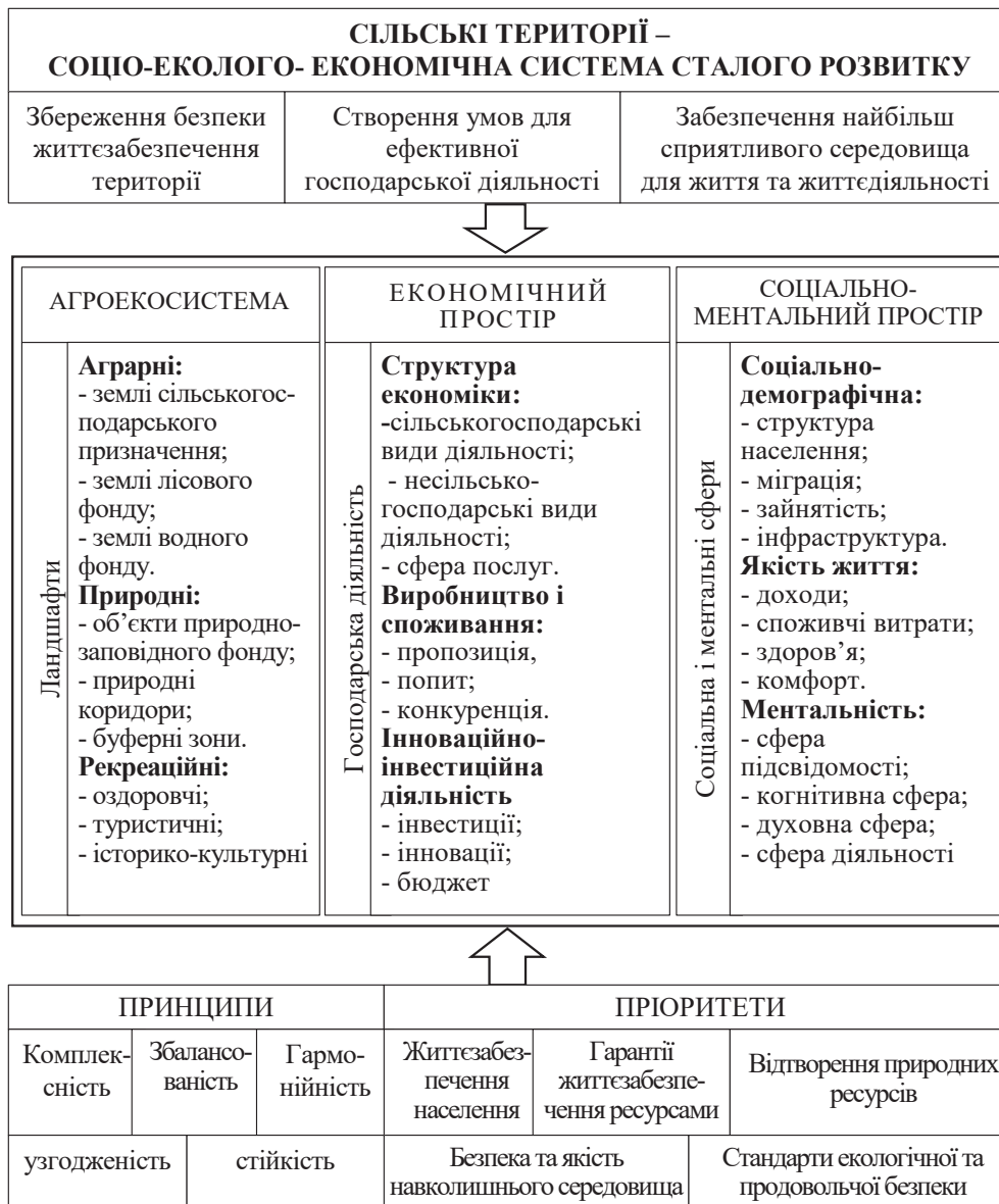
Рис. 1. Сільські території як система сталого розвитку