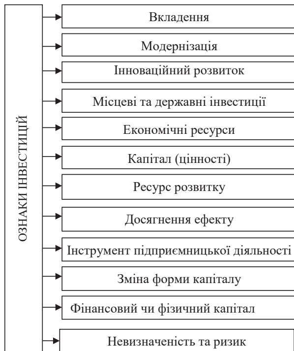
Рис. 1. Основні ознаки інвестицій

Проаналізувавши різні визначення інвестицій, можна виокремити такі основні ознаки інвестицій (рис. 1).