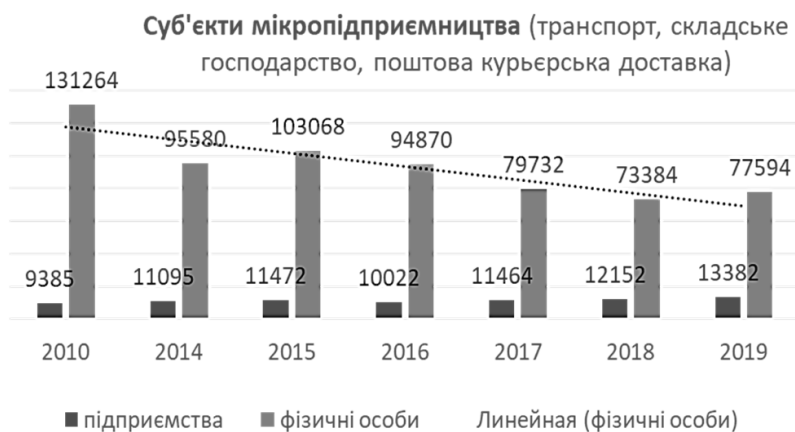
Рис. 3. Кількість суб'єктів мікропідприємництва за видом економічної діяльності