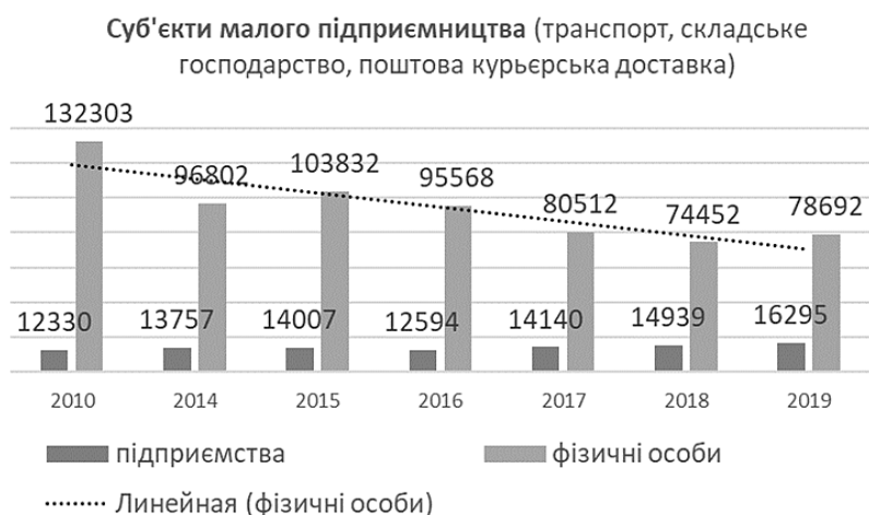
Рис. 2. Кількість суб'єктів малого підприємництва (за видом економічної діяльності)