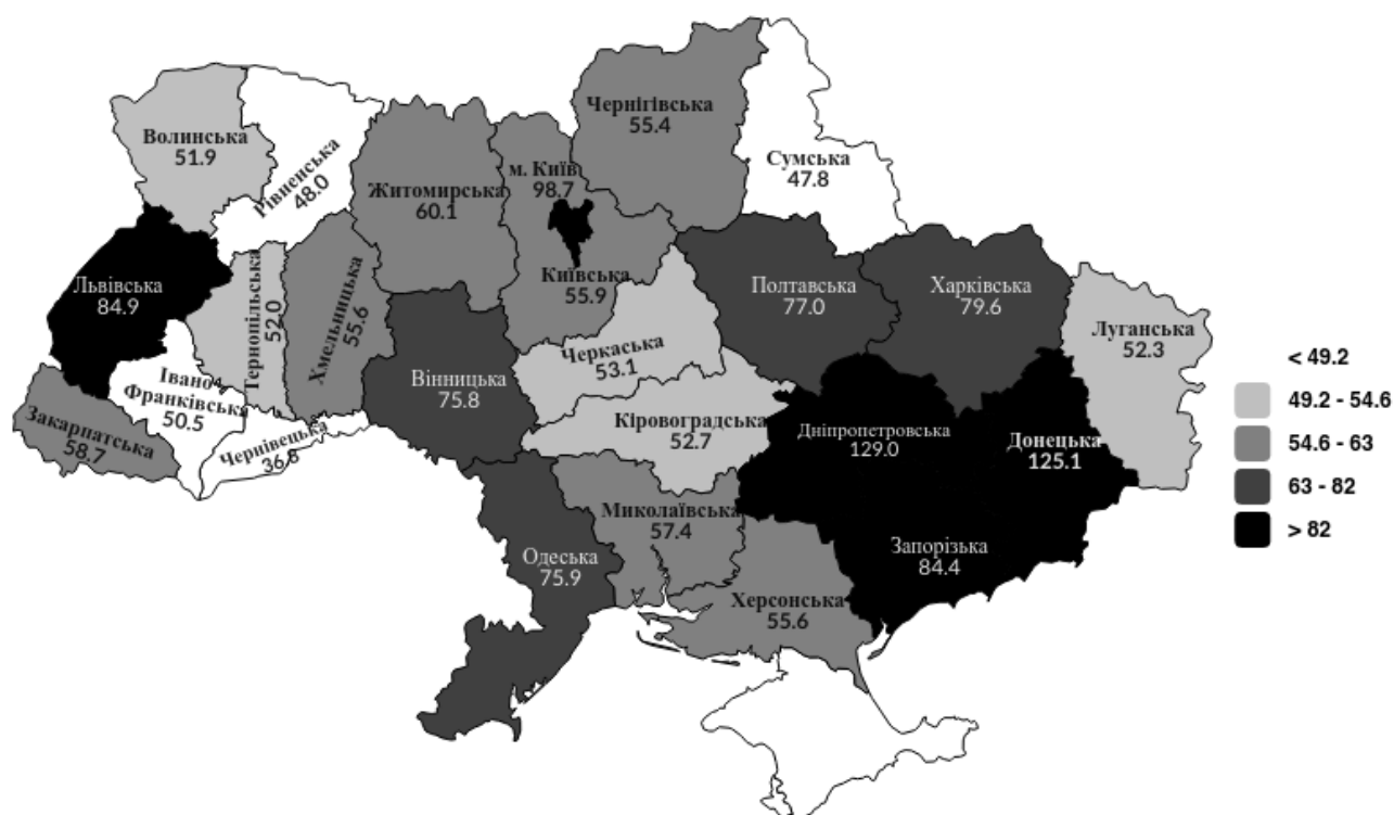
Рис. 1. Чисельність безробітного населення в регіонах України у 2020 році, тис. осіб