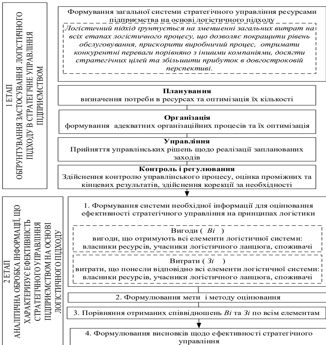
Рис. 2. Етапи впровадження логістичного підходу в систему стратегічного управління підприємницькими структурами

Враховуючи існуючі підходи та визначення логістики зауважимо, що більшість із них уніфіковано характеристиками наукової діяльності,