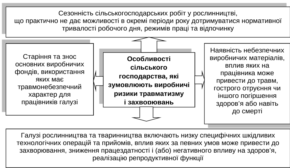
Рис. 1. Система основних особливостей сільського господарства, які зумовлюють виробничі ризики травматизму і захворювань персоналу

Соціально-трудова відносина у сфері умов та охорони праці в аграрному секторі, як і в будь-