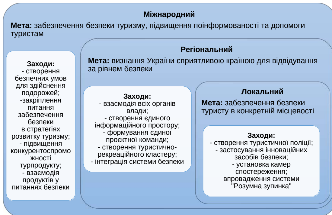
Рис. 2. Модель концепції безпеки туризму

2) Регіональний рівень. Метою розвитку туризму на регіональному рівні є прагнення до