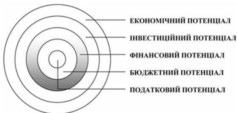
Рис. 1. Місце фінансового потенціалу у структурі економічного потенціалу на макрорівні