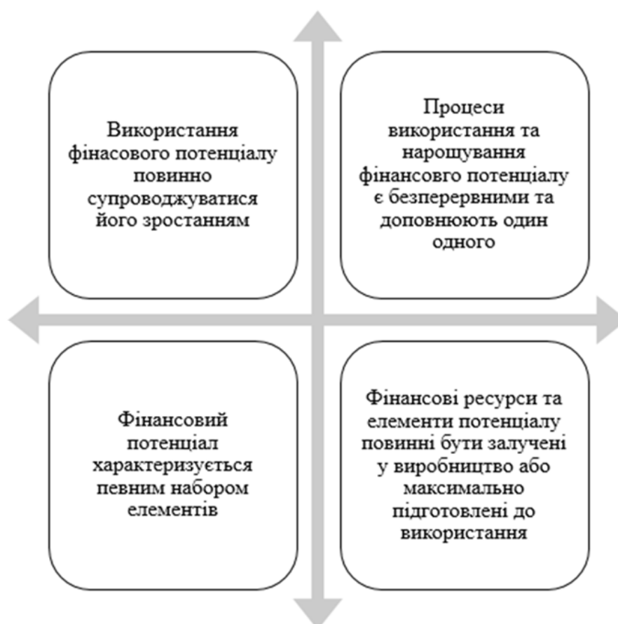
Рис. 4. Характерні особливості фінансового потенціалу підприємства