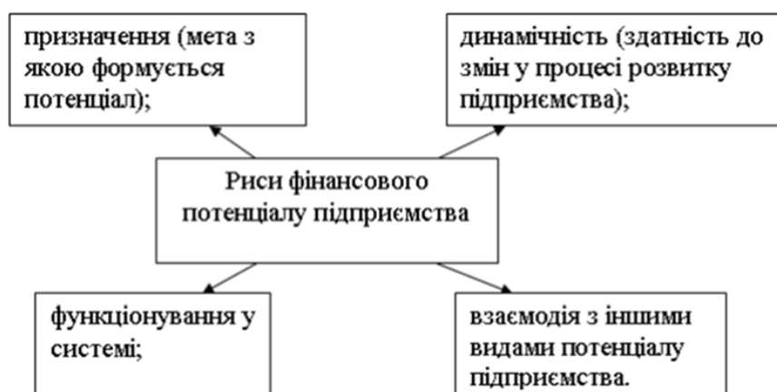
Рис. 3. Характерні риси фінансового потенціалу підприємства в умовах забезпечення його ефективності

Водночас необхідно зауважити, що фінансовий потенціал підприємства забезпечує реалізацію всіх процесів діяльності та розглядається як теперішня основа для отримання майбутніх результа-