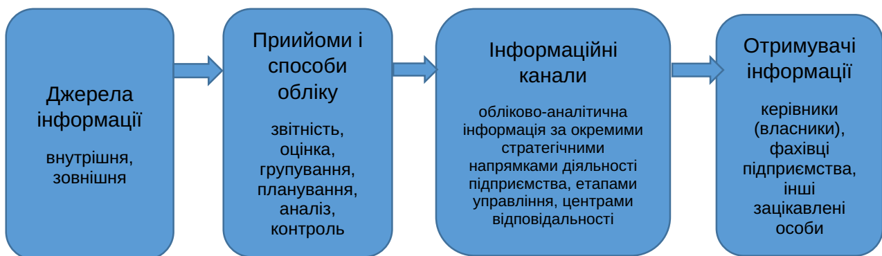
Рис. 1. Складові процесу стратегічного обліку

Аналізуючи діяльність з урахуванням як поточних і довгострокових цілей та розробляючи методи збирання інформації про вирішальні фактори успіху (якість, інновації, час тощо), управлінський облік забезпечує інформаційні потреби не тільки виробництва, а й маркетингу, управління дослідженнями та інших функцій бізнесу. Необхідність впровадження складової стратегічного управління в облікові процеси підприємства обумовлена сучасними вимогами до ефективної діяльності. Роль стратегічного управлінського обліку полягає в забезпеченні керівництва підприємства внутрішньою і зовнішньою фінансовою та нефінансовою інформацією, необхідною для планування, аналізу та контролю розвитку компанії в інтересах власників і інвесторів, а також у здатності вираження та відображенні стратегічних завдань і планів у конкретних показниках [17].