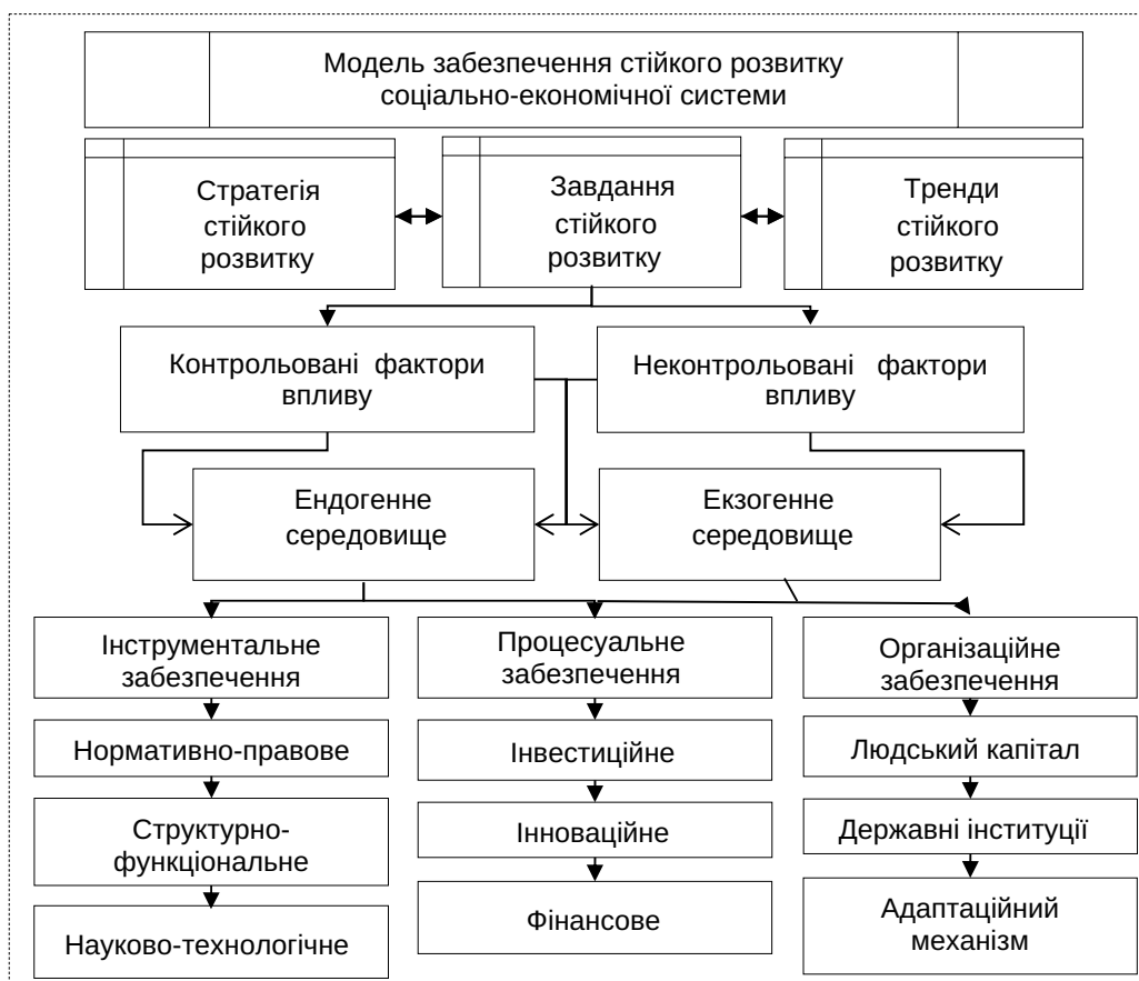
Рис. 1. Модель забезпечення стійкого розвитку соціально-економічної системи