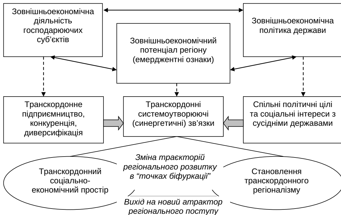
Рис. 1. Транскордонне співробітництво: передумови виникнення і роль в економічному розвитку регіонів

“Транснаціональний простір” ототожнюється з постійними потоками людей, товарів, ідей, символів, послуг через кордони [19, с. 49]. У контексті теорії транснаціональних просторів міжнародні економічні відносини (як і феномен регіонального співробітництва) сприймаються як сфера взаємодії не лише державних органів, а й різноманітних суспільних інституцій, а також агентів, які беруть участь у здійсненні транснаціональних комунікаційних зв’язків. Таким чином, сучасні регіональні й трансрегіональні взаємодії підтверджують когнітивну цінність моделі “дворівневої гри”,