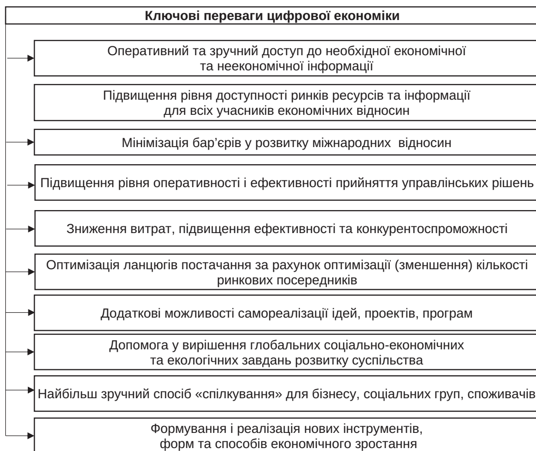
Рис. 1. Переваги цифрової економіки над традиційною

Разом з тим, рівень розвитку цифрових процесів у світі характеризується значними відмінностями,