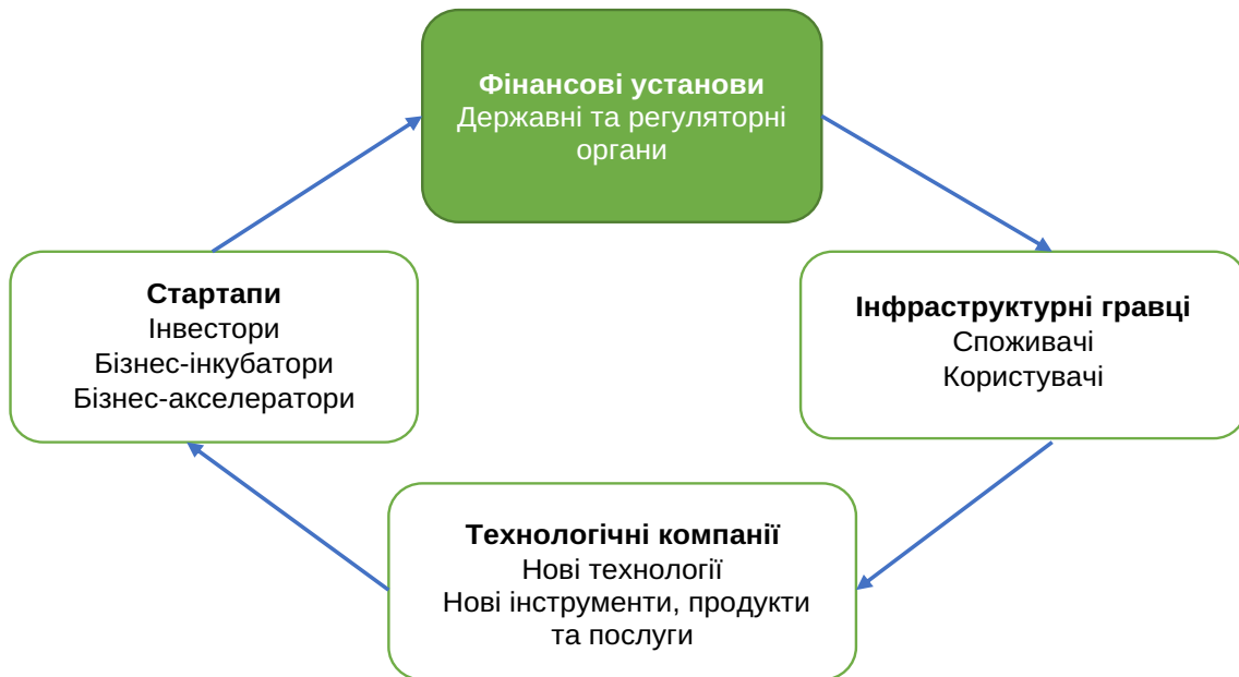
Рис. 1. Учасники фінтех-ринку та їх взаємодія

Це, в свою чергу, сприяло появі на вітчизняному фінансовому ринку нових суб'єктів, які не є комерційними банками, але виконують їх "традиційні" функції, пов'язані з платежами та грошовими переказами (небанківські платіжні системи, що здійснюють переказ коштів: "iPay.ua", "Portmone.com", "GlobalMoney", "City24", "Укркарт" та ін.); кредитування (мікрофінансові організації, які надають онлайн кредити: Moneyveo, Global Credit, CreditKasa та ін.; сервіси P2P та P2B кредитування, зокрема, "Finhub", "MoCash", "FinStream" та ін.), продаж валюти (сервіси продажу криптовалют: онлайн-біржі "Exmo", "Kuna", "BTC Trade UA"; термінали компаній "Tyme", "iBox"; онлайн-обмінники "Bitcoin", "Ethereum", "Litecoin"; спеціалізовані платіжні термінали (криптовалюти)). Ці організації, які отримали назву фінтех-компаній, використовують високоінноваційні технології та пропонують споживачам існуючі фінансові продукти на більш привабливих умовах і за нижчими цінами або розробляють нові платіжні інструменти та технічні рішення. Згідно зі звітом McKinsey &