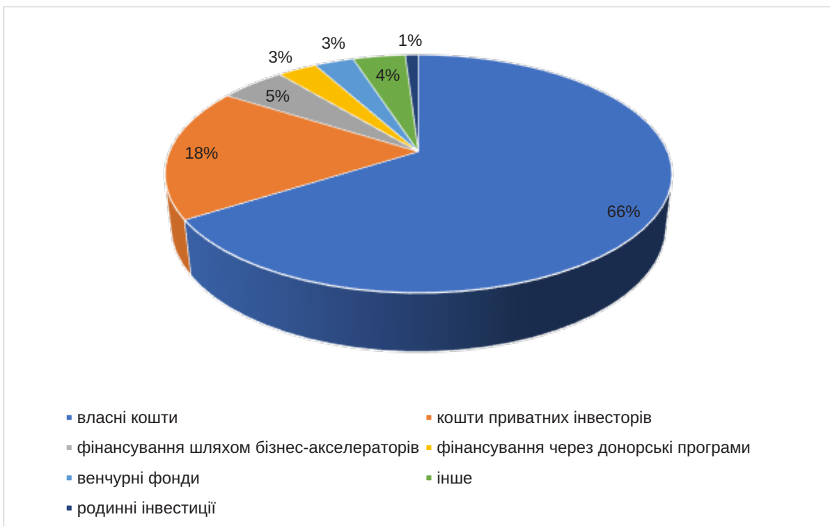
Рис. 2. Джерела фінансування фінтех-компаній в Україні у 2021 році

Державні регулятори фінансового ринку формують відповідну законодавчу базу, як фундамент для узгодженого, системного і цілеспрямованого розвитку вітчизняних фінтех компаній, так Національний банк України затвердив Стратегію розвитку фінтеху в Україні до 2025 року (далі – Стратегія) як покроковий план створення в Україні повноцінної фінтех-екосистеми з інноваційними фінансовими сервісами та доступними цифровими послугами.