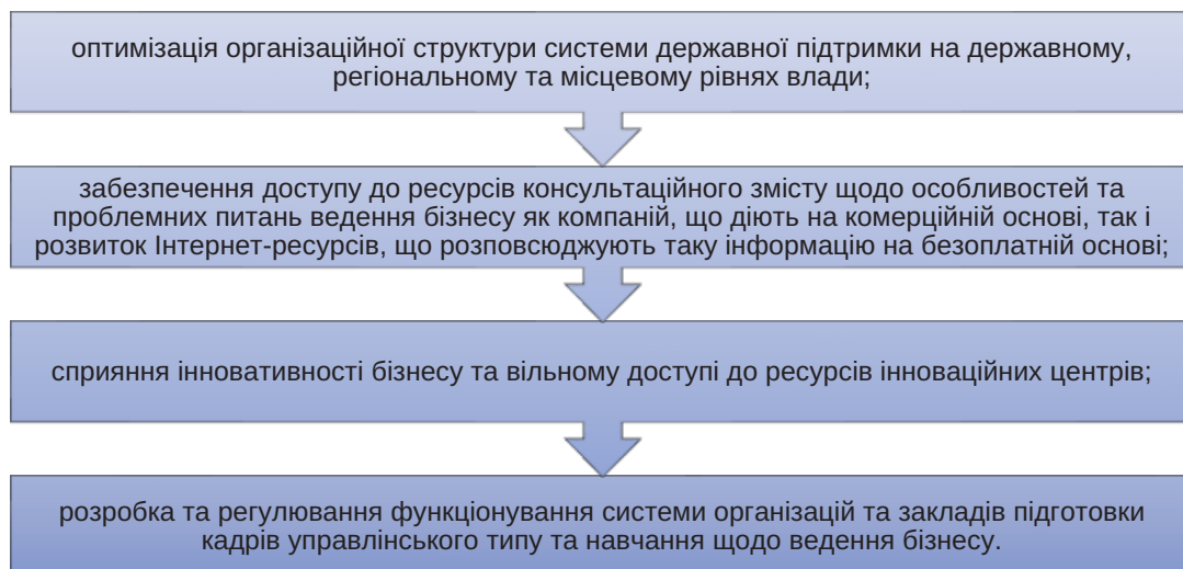
Рис. 3. Другий блок державної підтримки