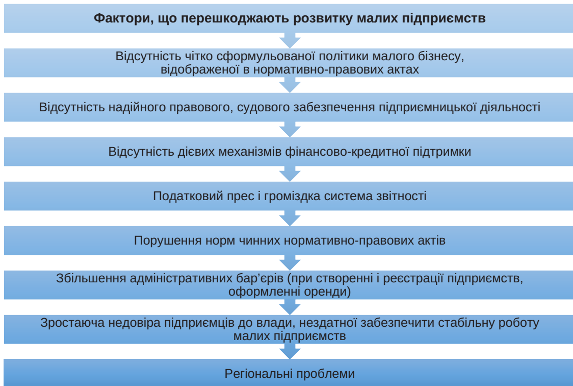
Рис. 1. Фактори, що перешкоджають розвитку малих підприємств