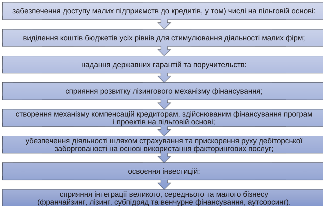
Рис. 2. Перший блок державної підтримки

Другий блок, що входить в систему державної підтримки, передбачає організаційне самовдосконалення цієї системи (рис. 3).