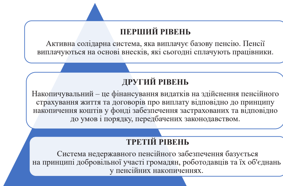
Рис. 1. Рівневність пенсійного забезпечення в Україні

4. Інвестування пенсійних коштів: Пенсійні фонди традиційно інвестують кошти в різні фінансові інструменти, такі як акції, зобов'язання, нерухомість тощо, з нарахуванням прибутку та збільшенням накопичень на пенсійних рахунках.