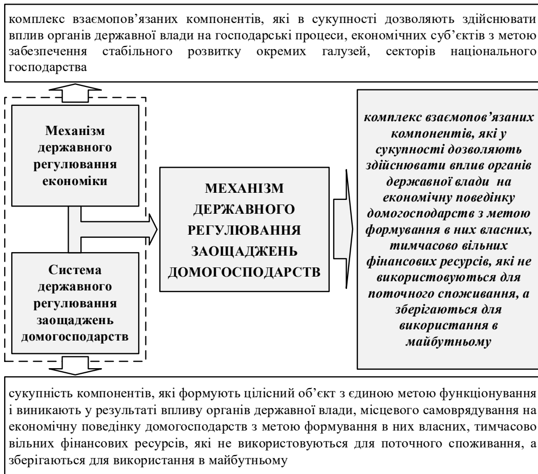
Рис. 1. Сутність механізму державного регулювання заощаджень домогосподарств

Зокрема, варто зауважити, що окреслений механізм за своєю природою також можна розглянути як цілісну, окрему систему, яка складається зі значної кількості елементів. Проте сам механізм щодо системи є тим їхнім елементом, який відображає саме процес, як система функціонує, як пов'язані її компоненти, як відбувається між ними взаємодія. На відміну від системи державного регулювання заощаджень домогосподарств, яка загалом відображає статичний зріз її компонентів і констатує наявність між ними взаємозв'язку,