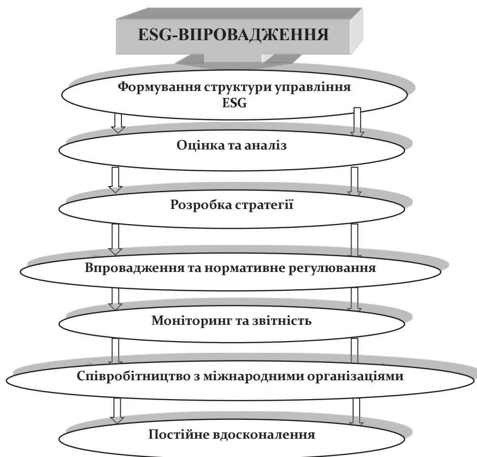
Рис. 1. Схема запровадження та адаптації ESG в умовах воєнного конфлікту в Україні