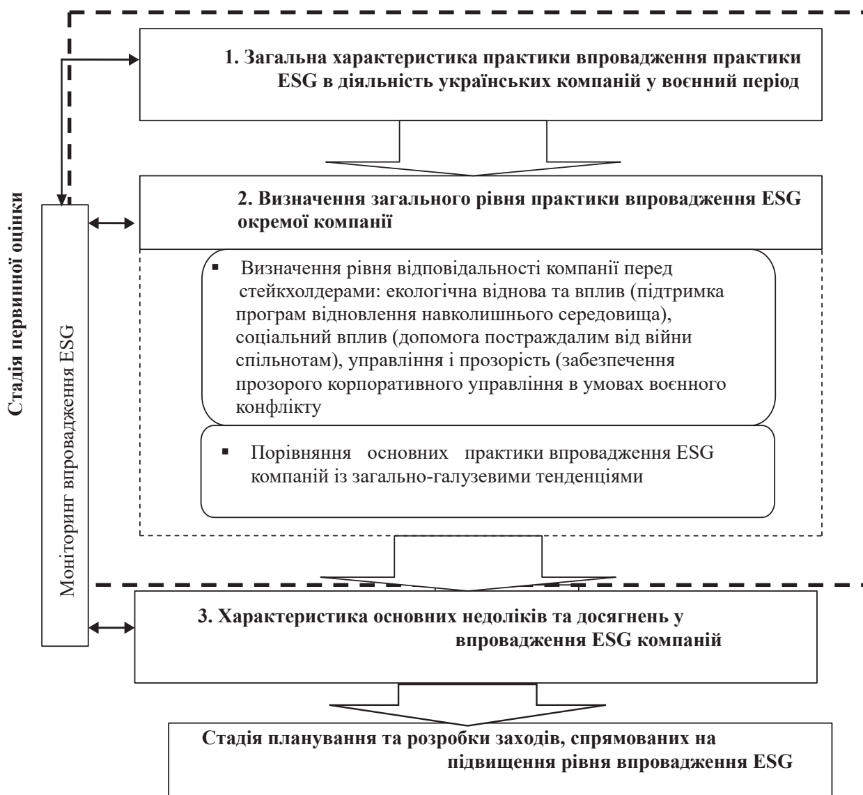
Рис. 3. Запропонована схема оцінки як основи покращення рівня впровадження практики ESG

– визначення основних понять та принципів практики ESG українських компаній, дозволило їх адаптувати під умови воєнного конфлікту та