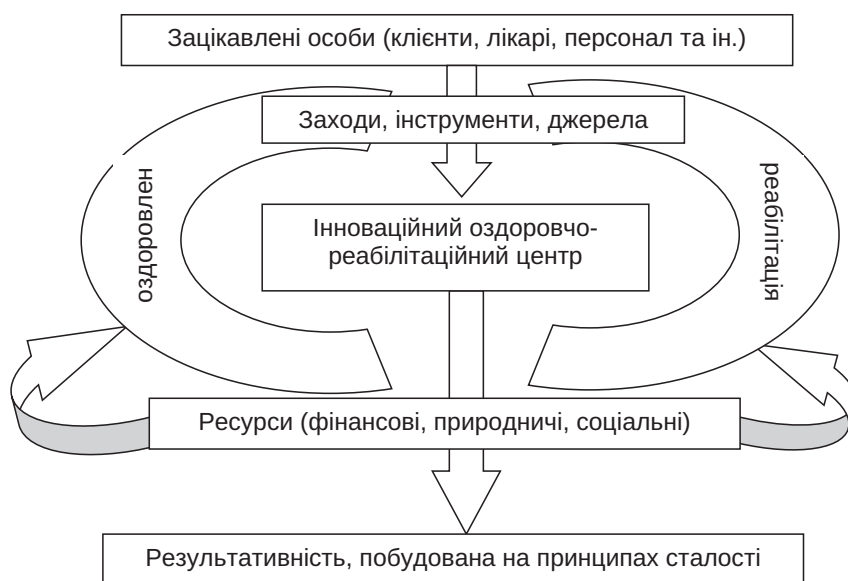
Рис. 2. Система управління інноваційного оздоровчо-реабілітаційного центру

Висновки. Досліджено переваги впровадження інновацій. Визначено можливості залучення відкритих інновацій, які можуть мати як